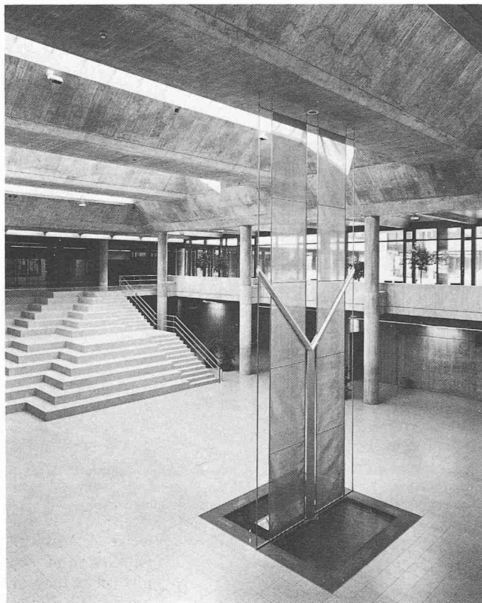
Lichthof mit Kunstwerken von L. Dall'Antonia «Treppe» und A. Hanselmann-Erne Plastik «Wasser, Erde, Luft, Licht, Wachstum, Verantwortung»

verfahren an, welches sich auch als Förderung von jüngeren Künstlern versteht. Es werden für einen Neu- oder Umbau in der Regel drei bis vier Künstler ausgewählt, welche sich in ihrer derzeitigen Schaffensphase mit der aus der räumlich-funktionellen Situation herauskristallisierten Problemstellung unverkrampft auseinandersetzen können.