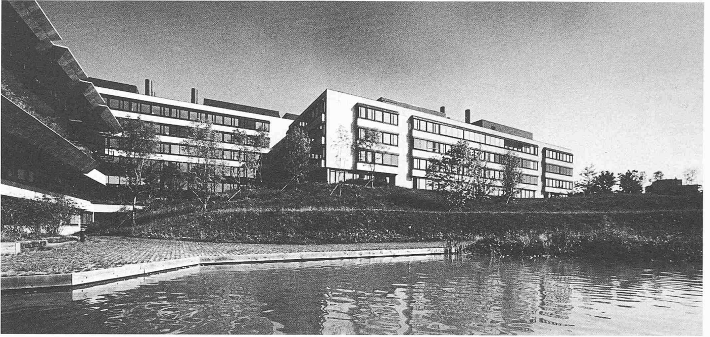
Institutsbauten der 2. Etappe. 2 vertikale Schachtzonen unterbrechen die Laborräume. An den Schmalseiten sind die Büros untergebracht. Links der Mensabau, im Vordergrund der künstliche Teich zwischen Universität und Staatsarchiv