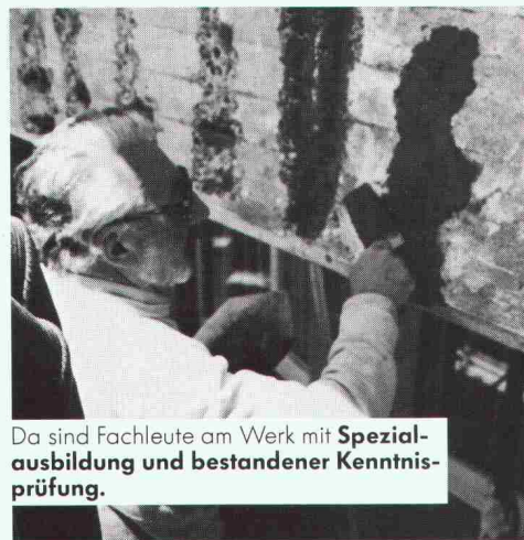
Da sind Fachleute am Werk mit Spezialausbildung und bestandener Kenntnisprüfung.