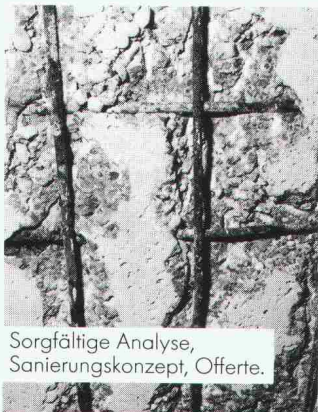
Sorgfältige Analyse, Sanierungskonzept, Offerte.

Und das ist auch nötig. Denn wer nur oberflächlich die Symptome bekämpft, erlebt bald wieder sein rostrotes Wunder.