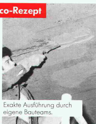
Exakte Ausführung durch eigene Bauteams.