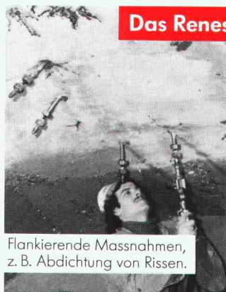
Flankierende Massnahmen, z. B. Abdichtung von Rissen.