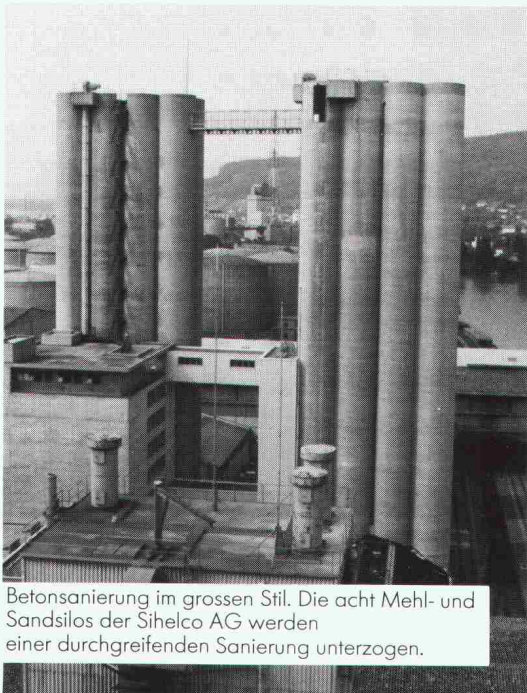
Betonsanierung im grossen Stil. Die acht Mehl- und Sandsilos der Sihelco AG werden einer durchgreifenden Sanierung unterzogen.