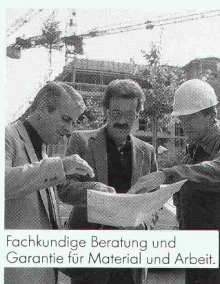
Fachkundige Beratung und Garantie für Material und Arbeit.