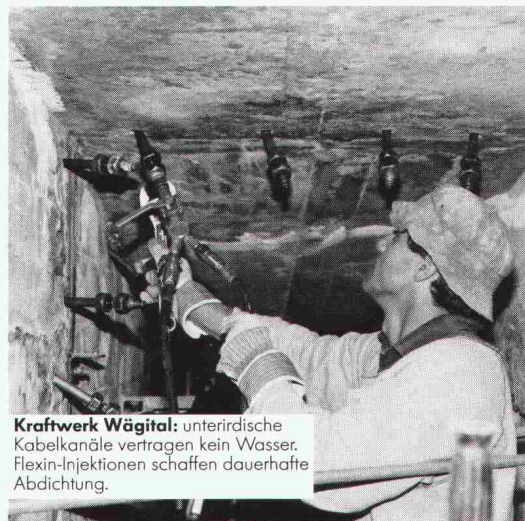
Kraftwerk Wägital: unterirdische Kabelkanäle vertragen kein Wasser. Flexin-Injektionen schaffen dauerhafte Abdichtung.

Für das Abdichten von Rissen, Fugen und undichten Stellen an neuen und alten Betonbauten sind Renesco-Flexin-Injektionen die sicherste Methode, unter allen Umständen. Flächenabdichtungen nach dem Renesco-Vandex-System schaffen trockene Untergeschosse, selbst wenn das Haus im Grundwasser steht. Die Renesco-Spezialisten arbeiten mit eigenen