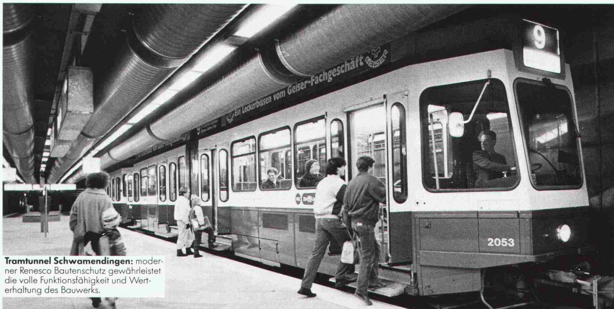
Tramtunnel Schwamendingen: moderner Renesco Bautenschutz gewährleistet die volle Funktionfähigkeit und Werterhaltung des Bauwerks.