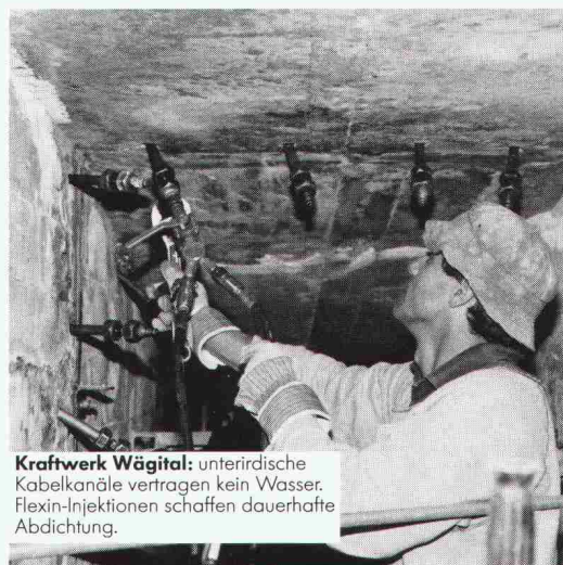
Kraftwerk Wägital: unterirdische Kabelkanäle vertragen kein Wasser. Flexin-Injektionen schaffen dauerhafte Abdichtung.

Für das Abdichten von Rissen, Fugen und undichten Stellen an neuen und alten Betonbauten sind Renesco-Flexin-Injektionen die sicherste Methode, unter allen Umständen. Flächenabdichtungen nach dem Renesco-Vandex-System schaffen trockene Untergeschosse, selbst wenn das Haus im Grundwasser steht. Die Renesco-Spezialisten arbeiten mit eigenen