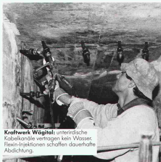
Kraftwerk Wägital: unterirdische Kabelkanäle vertragen kein Wasser. Flexin-Injektionen schaffen dauerhafte Abdichtung.

Für das Abdichten von Rissen, Fugen und undichten Stellen an neuen und alten Betonbauten sind Renesco-Flexin-Injektionen die sicherste Methode, unter allen Umständen. Flächenabdichtungen nach dem Renesco-Vandex-System schaffen trockene Untergeschosse, selbst wenn das Haus im Grundwasser steht. Die Renesco-Spezialisten arbeiten mit eigenen