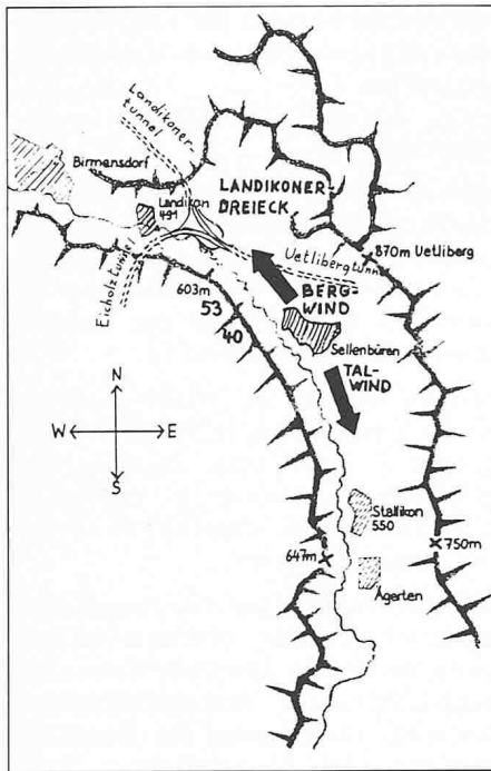
Bild 1. Reppischtal, Landikonerdreieck und Hauptwindrichtungen