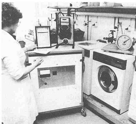
Prüfung von Waschautomaten im SIH. Alle Programme werden einzeln ausgemessen und nach Dauer, Temperaturverlauf sowie Wasser- und Energieverbrauch. Die Resultate der einzelnen Waschgänge werden nach den Kriterien «Sauberkeit» und «Verschleiss» anhand festgelegter Menge «standardisierter Schmutzwähe», deren Zusammensetzung und Verschmutzungsgrad definiert ist.

menten über die Ergebnisse zu informieren. Die steigende Zahl der Neuentwicklungen und Produktverbesserungen auf dem Gebiet der Hauswirtschaft hat das Verlangen nach Markttransparenz noch gesteigert. Die Akzentuierung der Umwelt- und Energieprobleme weckte neuen Informationsbedarf.