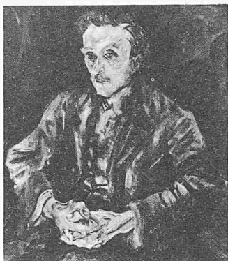
O. Kokoschka: Bildnis des Architekten Adolf Loos

Vom 4. September bis 2. November werden im Kunstmuseum Bern über 80 Gemälde der ehe-