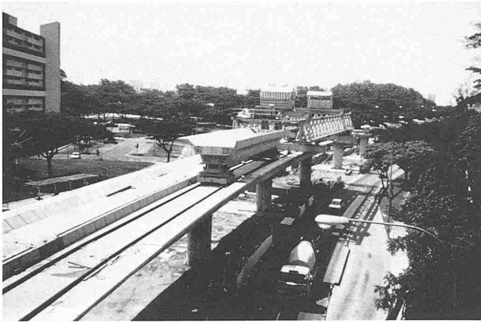
Bild 18. MRT Singapur: Transport des Brückenträgers auf dem bereits montierten Brückenüberbau bis zum Einbaugerät