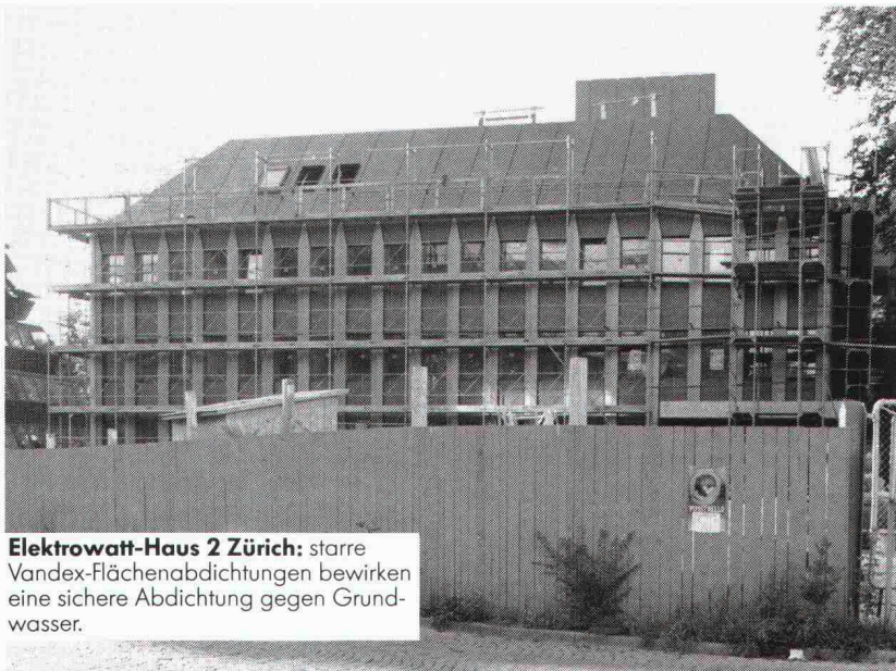
Elektrowatt-Haus 2 Zürich: starre Vandex-Flächenabdichtungen bewirken eine sichere Abdichtung gegen Grundwasser.