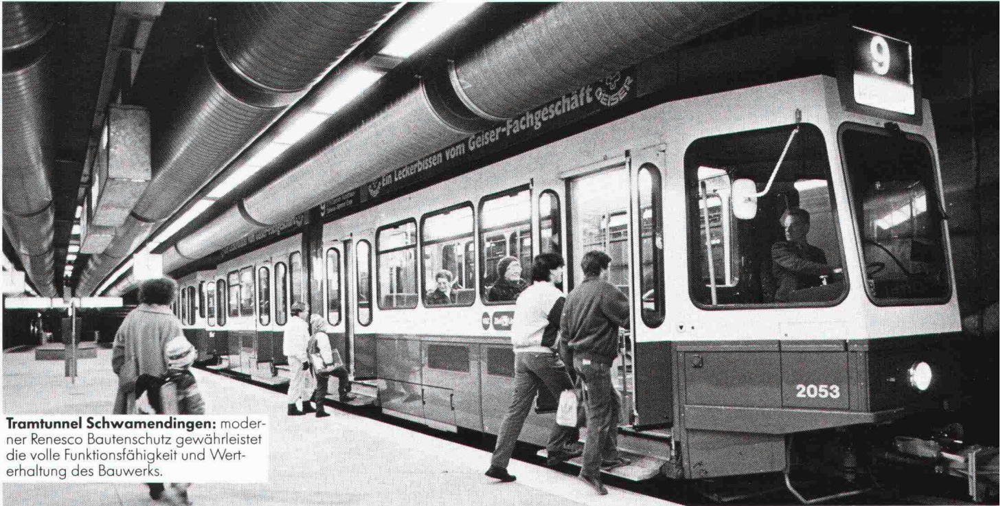
Tramtunnel Schwamendingen: moderner Renesco Bautenschutz gewährleistet die volle Funktionsfähigkeit und Wert-erhaltung des Bauwerks.