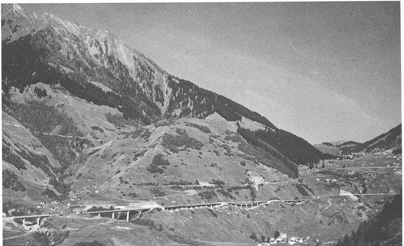
Bild 3. Dank dem Bau von hangparallelen Brücken und Lehenbrücken konnte im steilen, rutschigen Hang oberhalb Mesocco auf riesige Stütz- und Futtermauern verzichtet werden

Adresse des Verfassers: K. Suter, dipl. Bauing. ETH, Direktor des Bauamtes für Strassenbau, Monbijoustrasse 40, 3003 Bern.