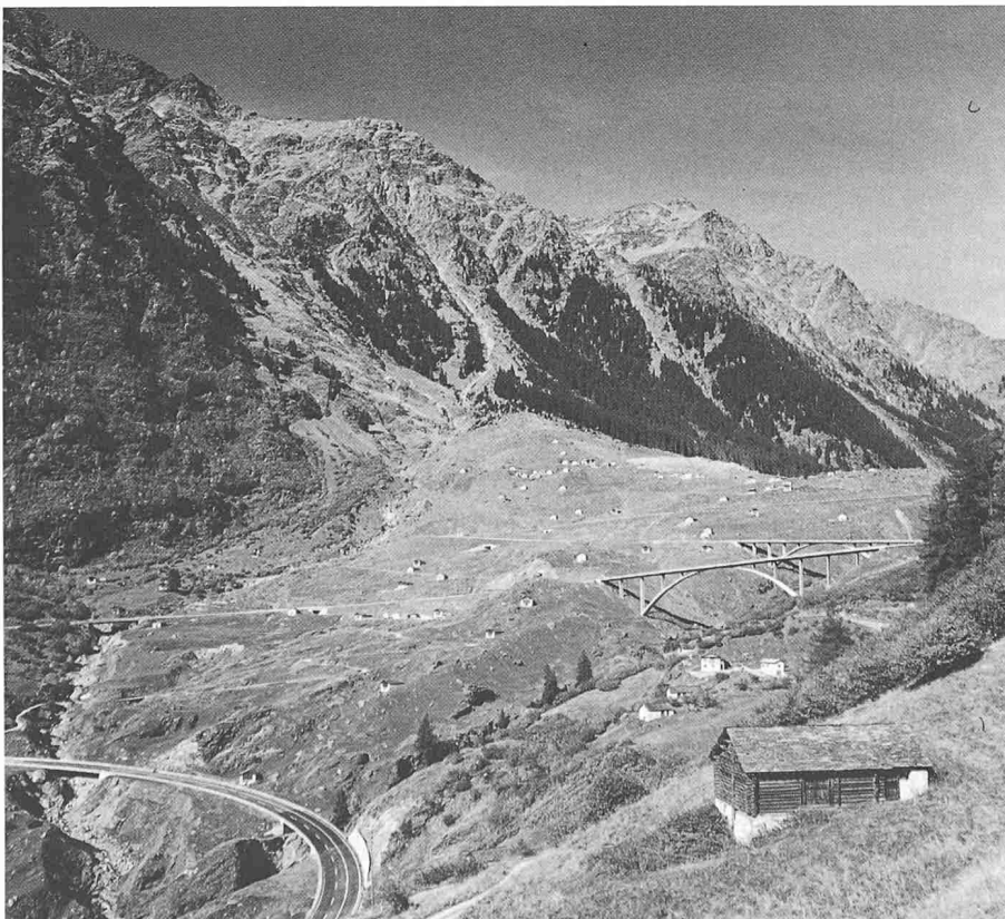
Bild 1. Mit dem Bau eleganter, den Formen des Geländes angepassten Brücken wurde es überhaupt erst möglich, in den steilen Talabfall des Miso (GR) die Nationalstrasse N 13 so zu bauen, dass sie heute die Landschaft kaum belastet

Jeder gestaltet die Wohnung, in der er lebt, wie es ihm gefällt, wie er es sich leisten kann, wie es ihm am besten nützt und mit den Mitteln, die er kennt. Das Zusammenwirken von Strasse, Umgebung, Brücken, Besiedlung und Natur ist keine konstante, definierbare Grösse: Im Tessin, in der Via Mala, am Genfersee oder im Zürcher Weinland liegen die Akzente anders. Die Gestaltung der Strasse und die Einpassung in ihr Umfeld verlangen Begabung, Beobachtungssinn und Schulung. Das Sichtbare ist das Massgebende. Die Brücken ihrerseits sind häufig das Sichtbare der ganzen Strasse. Hier gilt als guter Grundsatz: «Das Funktionelle ist das Schöne.» Mir genügt er jedoch nicht. Brücken, die die Strasse im Gelände sichtbar machen, müssen dazu auch eingepasst sein. Eine funktionell ein-