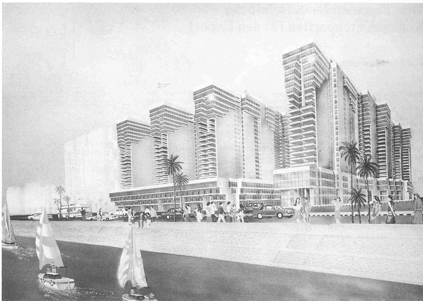
Bild 3. «Artists View» der Nile Corniche Towers; Architekten United Architects und Prof. Mohamed Kamel, Kairo; Bauherr Nile Housing Company, Kairo

Zweifelloos wird unsere Marktchance zusätzlich gefördert durch die sich häufenden Häusereinstürze, die einen allerdings nicht erstaunen, wenn man sieht, wie fahrlässig zum Teil gebaut wird. Wir haben im Laufe der Zeit gelernt, dass nur einfachste Konstruktionen und Details – meistens Flachdecken auf Betonstützen und aussteifende Kerne oder Schubwände – richtig ausgeführt werden können und dass natürlich die lokal erhältlichen oder machbaren Materialqualitäten berücksichtigt werden müssen.