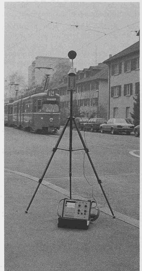
Bild 2. Modernes Lärmmessgerät mit Pegelschreiber zur Aufzeichnung des zeitlichen Lärmverlaufes

Die Immissionsgrenzwerte für den Tag wurden für die Stufe I mit 55 dB(A) festgelegt, für die Stufe IV mit 70 dB(A); die Nachtwerte sind generell 10 dB(A) niedriger als die entsprechenden Tageswerte.