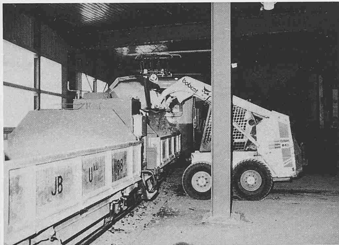
Für den Transport loser Materialien wie Kies und Sand dienten die Kippwagen der Jungfrauabahn