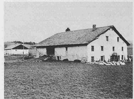
Anciennes fermes à Muriaux (Franches-Montagnes)

Im 2. Teil kommen vorwiegend Architekten zu Worte. Dienstleistung und Subventionspraxis sind die wichtigsten Mittel der eidgenössischen Denkmalpflege. Experten und Fachleute für Spezialfragen stellt der Bund den Kantonen zur Verfügung und zwingt sie ihnen bei unter eidgenössischem Schutz stehenden Bauten auch auf, was gelegentlich zu Meinungsverschiedenheiten führt. Die eidgenössische Denkmalpflege befasst sich aber nicht nur mit erstangigen Bauten. Die bundeseigenen Bauten liegen auch in ihrer Obhut. Den wichtigsten Anteil haben hier die 800 Aufnahmegebäude der SBB, 600 davon stammen aus dem letzten Jahrhundert, und viele davon sind schüt-