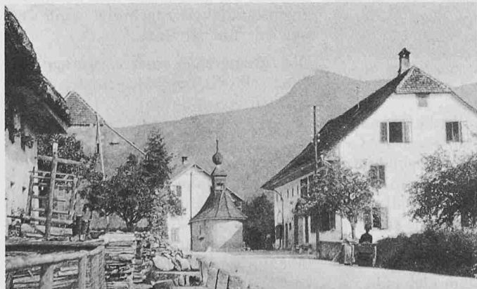
Zu Beginn des Jahrhunderts war die Kapelle in den Strassenraum eingebunden. Wo nicht Häuser ihn begrenzen, waren es Gärten, Bäume, Sträucher und Holzbeigen - Heute: In der Asphaltwüste steht noch, deplaziert, die Kapelle. Der rücksichtslosen Verkehrsschneise fielen ganze Häuserzeilen zum Opfer; Renditen-Objekte traten an ihre Stelle. Trimbach bei Olten

pflege. In dem über 200 Seiten starken, vom Bund grosszügig unterstützten Heft äussern sich ungefähr 50 Fachleute zu den vier folgenden Themen: Denkmalpflege in der Schweiz 1886-