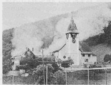
Kloster Beinwil während des Brandes vom August 1978

Giuseppe Gerster und Pierre Margot, beides Architekten, befassen sich mit einem Wiederaufbau und einer Restaurierung. Das Konzept des abgebrannten Klosters Beinwil erklärt Gerster wie folgt: «Konservieren der von den Flammen verschonten Aussenmauern. Ergänzen der fehlenden Bau- und Dekorteile im Sinne des Originals. Gestalten des Innenraumes mit zu kaufenden Objekten aus der Bauzeit und aus dem gleichen kulturellen Umfeld.» So stammt der barocke Hochaltar aus Bellwald im Wallis. Zudem ist die Gelegenheit der Brandkatastrophe benützt worden, um den Bau von «unschönen Zutaten des 19. Jahrhunderts zu befreien». Stellt nicht das dem Artikel vorangestellte Zitat von Umberto Eco – «Der krampfhafteste Wunsch nach dem Quasi-Echten entsteht immer nur als neurotische Reaktion auf Erinnerungsleere» – die Bemühungen des Autors in Frage? Pierre Margot versteht sein Vorgehen zur Wiederherstellung der Abbatiale de Payerne als beispielhaft auch für ande-