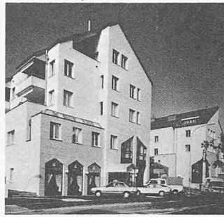
Wohn- und Geschäftshaus in Thalwil

Das hochwertige, feinkeramische, natürliche Material der Vilbofa-Elemente erweist sich durch seine Farbbeständigkeit und Widerstandsfähigkeit gegen