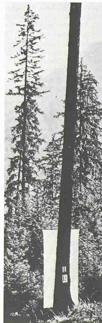
Bild 5. Zustände wie die der Nadelbäume im Hintergrund erregten vor fast 50 Jahren überhaupt kein Aufsehen. Heute wird ein solcher Nadelverlust der Luftverschmutzung angelastet (Bild aus Mittl. Eidg. Anstalt forstl. Versuchswesen, 22, 1941)