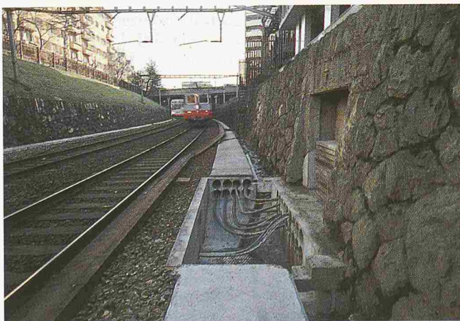
Bild 3. Schaltposten im Bahnhof Luzern im Bau. Die einzelnen Sektoreinspeisungen sind vorbereitet (Ringe an Quersaiten)