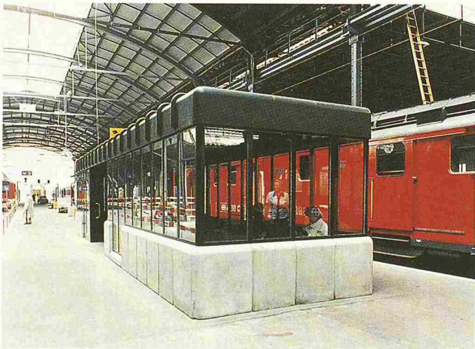
Bild 2. Neue Perron-Sitzbankeinheit