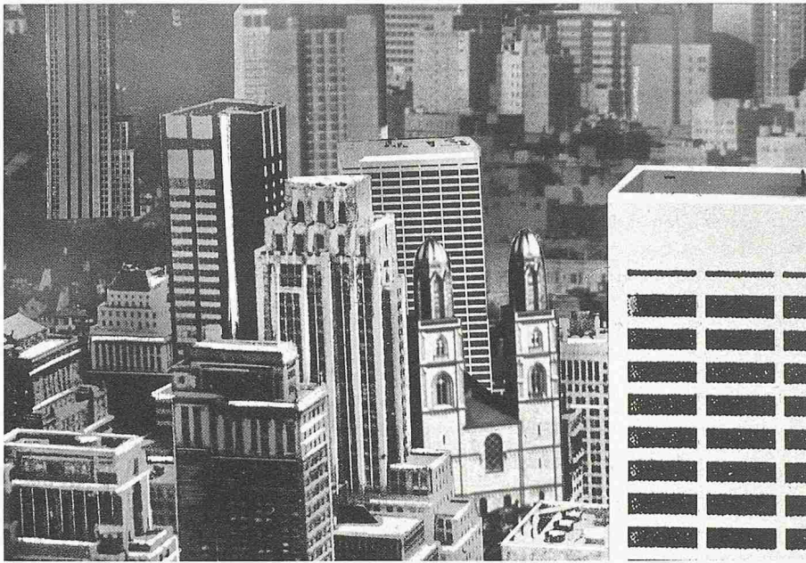
Zürich wie New York...?

... mit maximal erschlossenem Stadtzentrum und gelösten Verkehrsproblemen?