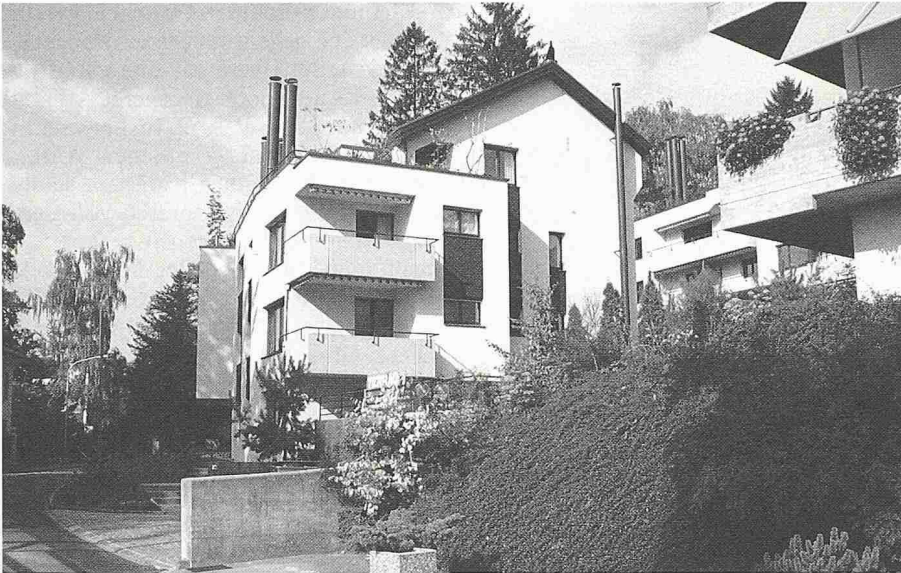
Bausünden am Zürichberg