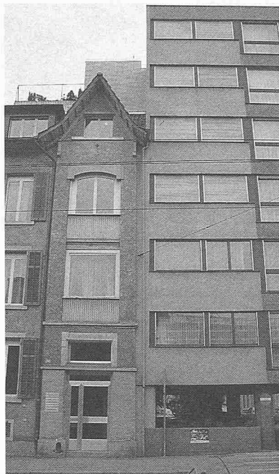
Bausünden in der Stadt: beide tun weh!

«Bauten, Anlagen und Umschwung sind für sich und in ihrem Zusammenhang mit der baulichen und landschaftlichen Umgebung im ganzen und in ihren einzelnen Teilen so zu gestalten, dass eine befriedigende Gesamtwirkung erreicht wird; diese Anforderung gilt auch für Material und Farben.»