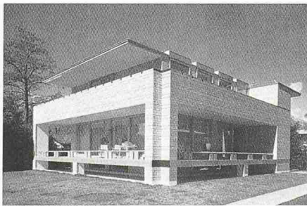
Haus in Ascona, Via delle Quercie

Das Schöne an diesem Buch: Es zeigt anhand hervorragender Aufnahmen einen sehr informativen Querschnitt durch das Schaffen Vacchinis. Den Fotografen gebührt viel Lob: Ich kann mir kaum vorstellen, wie das Besondere dieser Architektur bildlich besser zur Darstellung gebracht werden könnte. Ohne die lärmige Gestik einer gewissen Tendenz in der Architekturfotografie geht es offensichtlich auch. Bestimmtheit des Ausdrucks, Fasslichkeit, das feine Spiel der Linien und Materialien und die augenfällige formale Zurückhaltung in Vacchinis Bauen wird hier auf eine ungewöhnliche Weise er-