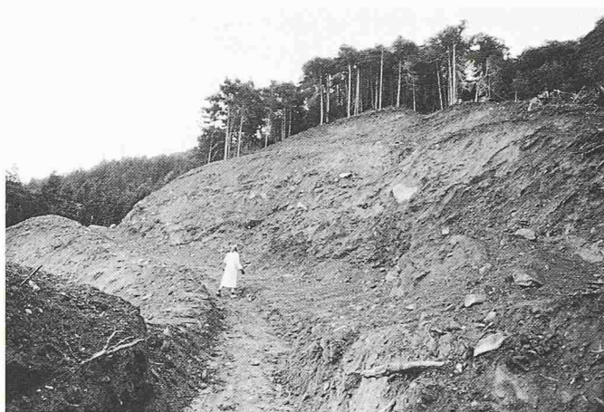
Bild 6. Die Kritik am Waldstrassenbau verstärkt sich, wenn dieser sichtbare Wunden in der Landschaft hinterlässt und dem Wald mehr schadet als nützt