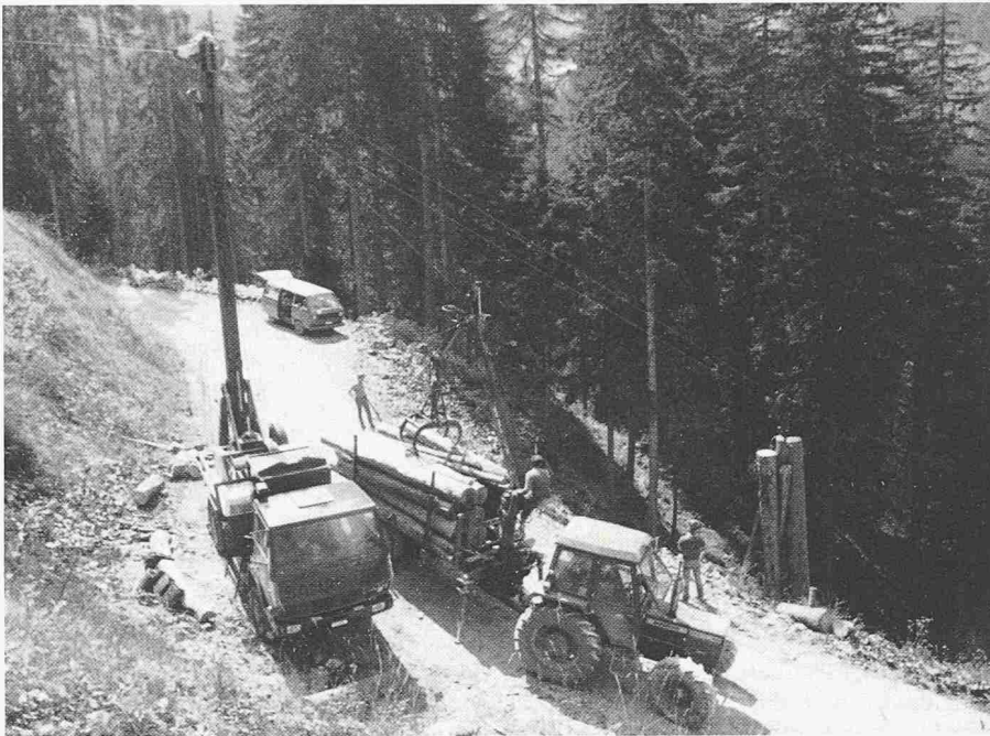
Bild 3. Der Mobilseilkran K-600 Sanasilva beim Bergauftransport von Trümmern aus einer Zwangsnutzung im Gebirgswald