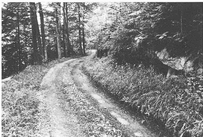
Bild 5. Waldstrassen können an geeigneten Stellen gut ins Landschaftsbild eingefügt und rücksichtsvoll geplant werden