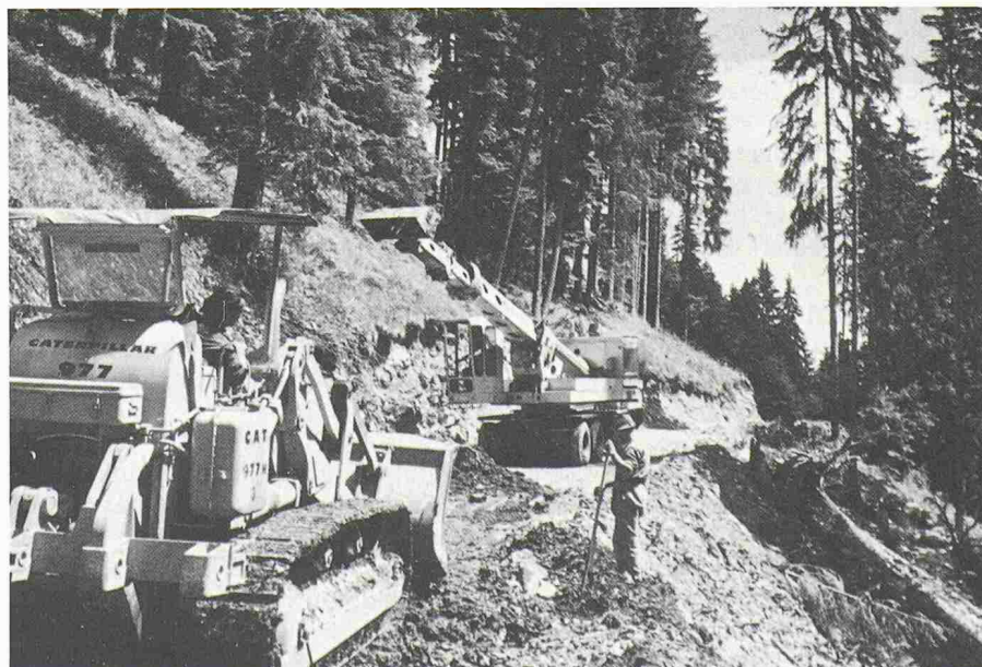
Bild 1. Im Berggebiet ist der Bau von Waldstrassen oft mit grossen Schwierigkeiten verbunden und bedeutet immer einen grossen Eingriff in die Natur (Foto im Simmental: FZ).

Die Tatsache, dass Forstdienste und Forstbetriebe lastwagenbefahrbar Strassen fordern, kann nur anhand des bestehenden Zusammenhangs zwischen Waldpflege und Holznutzung erklärt werden, denn diese Strassen werden hauptsächlich durch den Abtransport des geschlagenen Holzes bedingt.