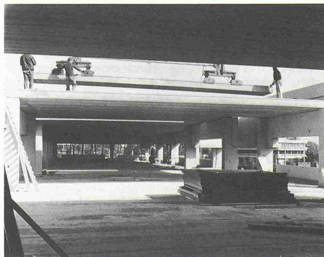
Bild 3. Halle mit freitragenden Deckenplatten über 15 m Länge – gefertigt mit Gleitfertiger