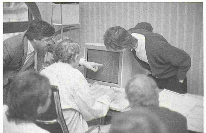
Bild 2. «Ich investiere lieber einen halben Tag in den SIA Workshop als viel Geld in eine CAD-Fehlentwicklung»