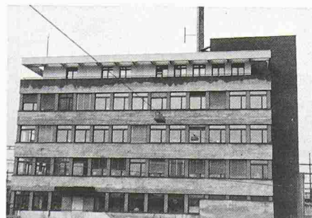
Bild 1. Gebäude-Ansicht. Die Stahlbetonstützen zwischen den Fensteröffnungen müssen auch den Stockwerk-Schub aus Windlasten aufnehmen. Diese Stützen bilden zusammen mit den Geschossdecken eine relativ biege weiche Rahmenkonstruktion

Die Untersuchung zeigte, dass es sich um eine schwach ausgesteifte Rahmenkonstruktion mit 5 Obergeschossen handelt (Bild 1). Sichtbare Schäden konnten nicht festgestellt werden. Die