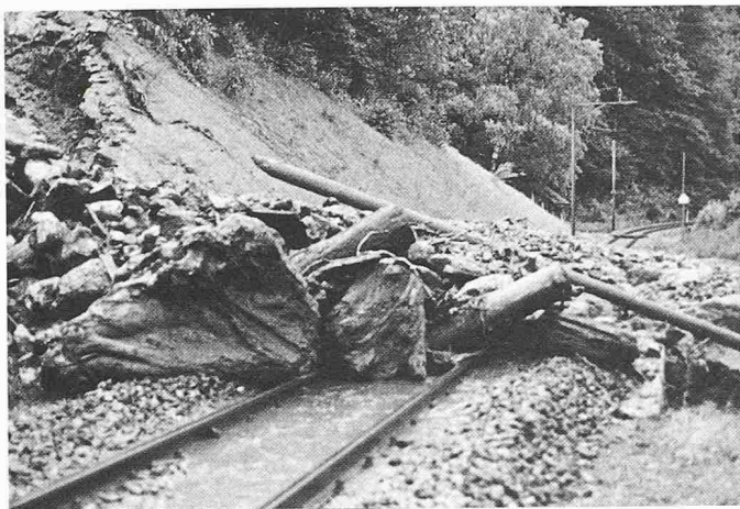
Bild 4. Mit Baumstämmen, Felsbrocken und Geröll hat der Husergraben-Bach bei Lungern 1986 das Bahngleis verschüttet