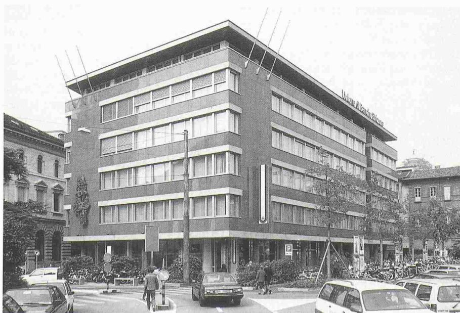
Bild 1. Ansicht der Unione di Banche Svizzere an der Piazzetta della Posta in Lugano