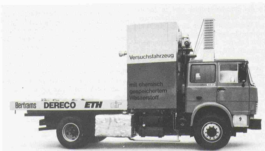
Bild 1. Wasserstoff-Versuchsfahrzeug der 2. Generation