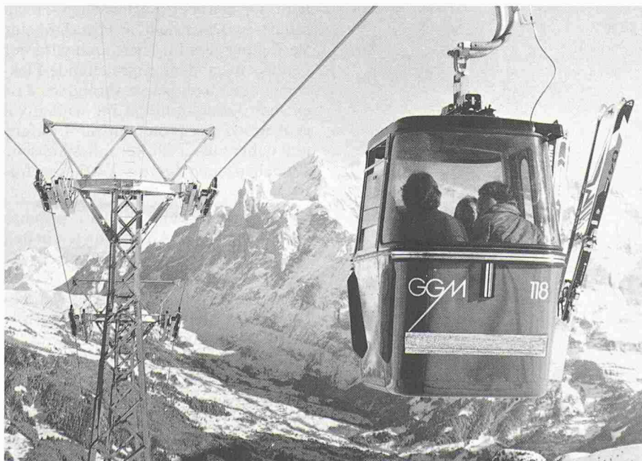
In den Skiferien verbrauchen wir rund zehnmal mehr Strom als daheim. Daraus resultieren sehr hohe Winterspitzen im Elektrizitätsbedarf der Winterkurorte

Angenommen wird bei dieser Berechnung, dass die Familie während der gesamten Feriendauer dreizehnmal in einem Mittelklasshotel übernachtet und an zwölf Tagen jeweils zehn Skiliftfahrten pro Tag absolviert. Aus diesem hohen Pro-Kopf-Verbrauch der Feriengäste resultieren die sehr hohen Winterspitzen im Stromverbrauch bei den Kurorten: In St. Moritz beispielsweise liegt die Nachfrage nach elektrischer Energie um die Jahreswende zwischen drei- und viermal höher als der Bedarf im «toten» Monat Mai.