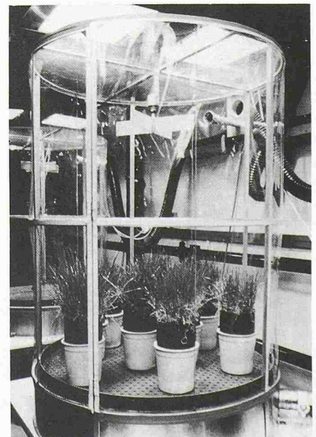
Expositionsanlage für Pflanzenversuche: In Pflanzenkammern werden Graskulturen katalysierten Automobilabgasen ausgesetzt, um zu untersuchen, ob sich in oder auf den Pflanzen Platin abgelagert.