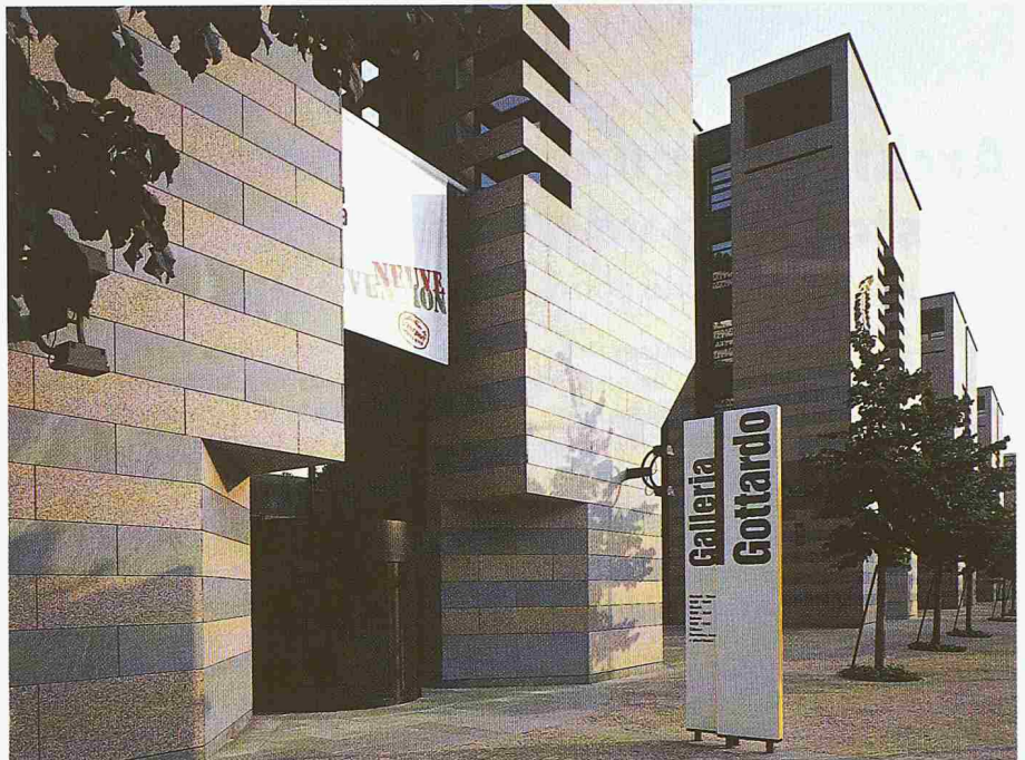
Der Eingang zur «Galleria Gottardo», die im Erdgeschoss des Bankhauses in Lugano zu finden ist

Adresse des Verfassers: Dr. C. von Castelberg, Gotthard Bank, Färberstr. 6, 8008 Zürich.