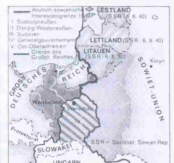
Die vierte polnische Teilung 1939