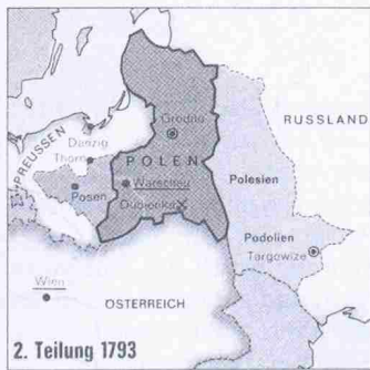
Preuß. und russ. Expansion