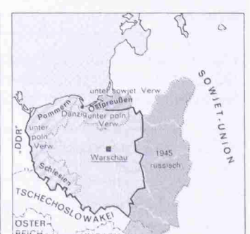
Die Volksrepublik Polen seit 1945