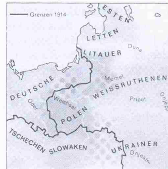
Die Nationalitäten 1914