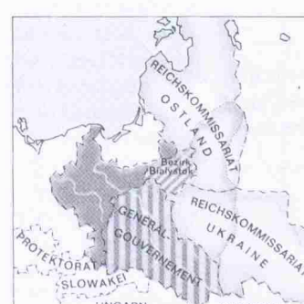
Polen unter deutscher Besetzung 1941–1944