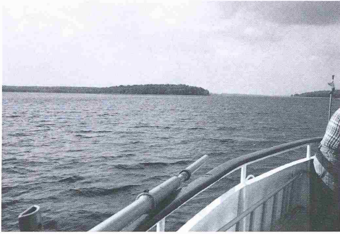
Bild 3. Masuren, weite Seenlandschaft, Heimat von Wiechert, Lenz und Dönhoff