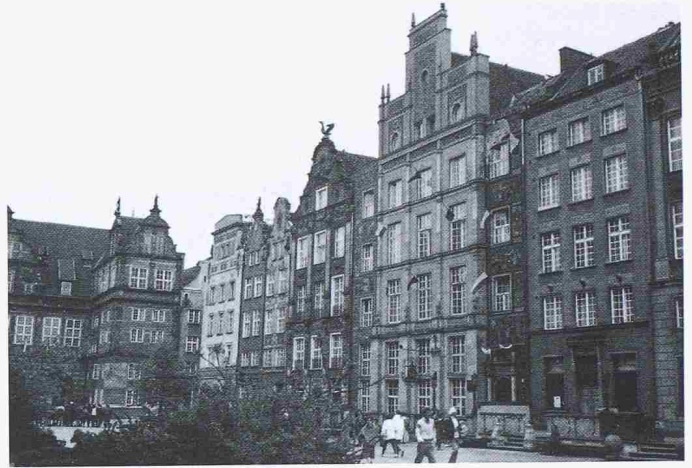
Bild 1. Danzig, Hauptstrasse, nach der kriegsbedingten vollständigen Zerstörung gemäss altem Vorbild wieder aufgebaute Fassaden mit zeitgemässer Nutzung (Wohnungen) dahinter

Eine völlig andere Stellung nimmt in der Nachkriegsentwicklung Krakau ein. So paradox es klingt: Weil Krakau praktisch unversehrt aus dem Krieg hervorgegangen ist, wurde keine Hilfestellung geleistet, so dass diese Stadt – im Gegensatz zu Warschau und Danzig und eigentlich als indirekte Folge des Krieges (alle Mittel flossen in die anderen Städte!) – besonders schwer an der Verpflichtung zur Erhaltung ihrer historischen Substanz zu tragen hat. Weitere Ausführungen zu den mit diesem Phänomen verbundenen, städtebaulichen Aspekten sind im Beitrag von U. Marbach enthalten (Seite 186).