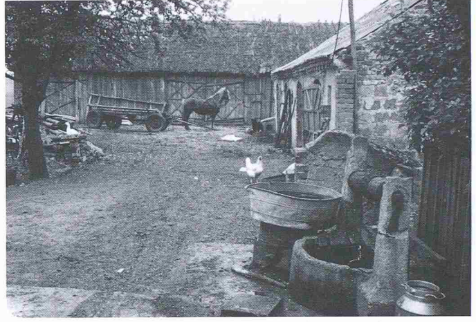
Bild 4. Bauernhof in Masuren. Der Hof vermittelt zwar einen idyllischen Eindruck, die eingesetzten Produktionsmittel werden aber einer zeitgemässen Agrarwirtschaft nicht mehr gerecht

als Industrienutzwasser verwendbar ist, weil die Anlageteile wie Pumpen, Leitungen usw. übermässiger Korrosion anheimfallen würden. So soll die Weichsel bei Danzig wie durch eine 10-Millionen-Einwohnerstadt belastet sein, obschon die Stadt weniger als eine Million Einwohner zählt. Die Danziger Bucht, bedeutungsvoll für die früher auch für uns legendären Badestrände, muss zeitweise als Katastrophengebiet bezeichnet werden (seltsam beeindruckend hier etwa beim Eingang zu einem Nobel-Hotel an der Ostseeküste ein stattlicher offener Kohlehaufen als Energieversorgung des Hotels sowie der während unseres Besuches dauernd pechschwarz qualmende Kamin als Kullisse des Badestrandes).