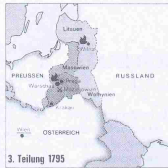
Die Auflösung Polens