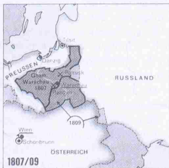
Das Großherzogtum Warschau