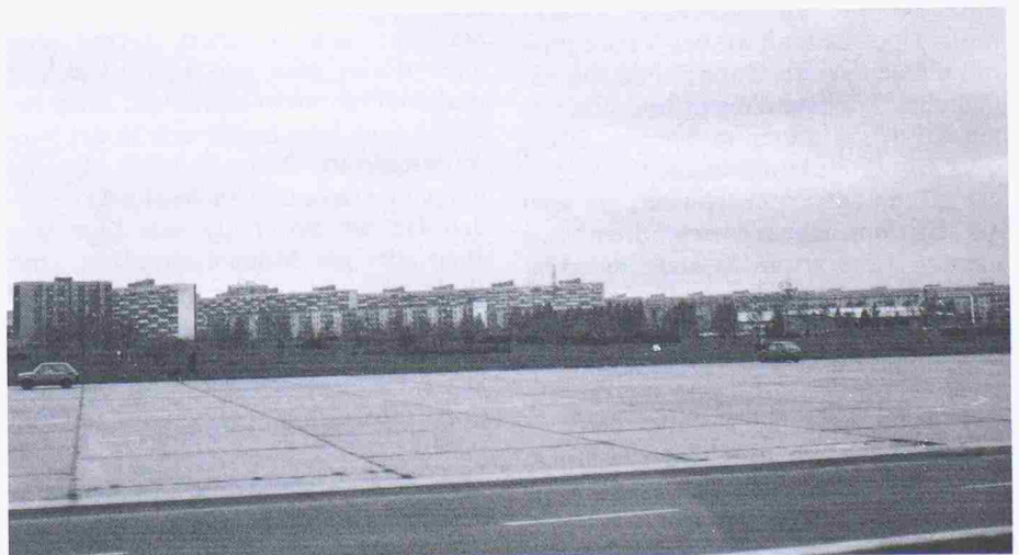
Bild 2. Danzig, Wohnsiedlung. Individualverkehr ist (noch) kein Thema

Ferner sind jedoch die als Vorfluter dienenden Gewässer stark bedroht, so letztlich das grosse Hauptentwässerungssystem des Landes, die Weichsel – beginnend bei Krakau bis hin zur Ostsee. Ursache sind nicht oder ungenügend geklärte kommunale Abwässer sowie Industrieabwässer, im Süden des Landes aber auch das stark mit Steinsalz belastete Grundwasser aus den Kohlengruben. Folge davon ist, dass das Weichselwasser nicht einmal mehr