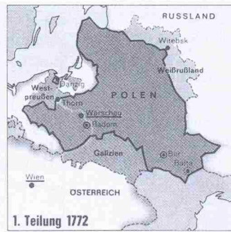
Russ., preuß. und österr. Gewinne