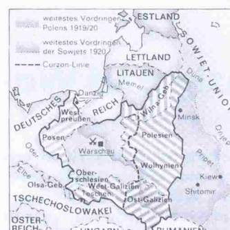
Die Republik Polen 1918–1939