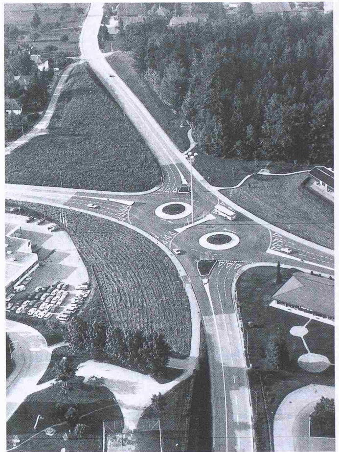
Bild 3. Verkehrsregelung durch einen Doppelkreisel in der Nähe von Fribourg (Villars-sur-Glâne) ohne Signalanlagen (Plater) (Luftbild)