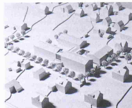
Projekt Haltinner AG, Buchs