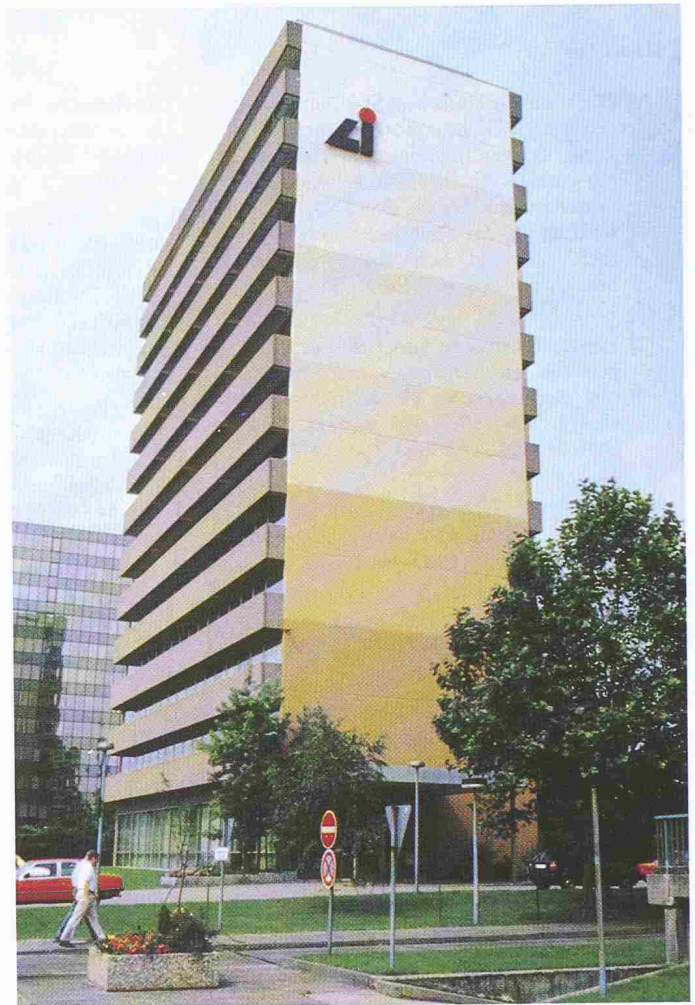
Bild 2. Verwaltungsgebäude nach der Instandsetzung der Sichtbetonflächen (2500 m 2 ) und Anbringen eines Oberflächenschutzes mit Farbzusatz (Jacobi)

beträgt 0,5 bis 5 Gw.-% [26]. PCC haben Zement als Hauptbindemittel und sind deshalb nachzubehandeln (Tab. 2 in [10]). Die Betondeckung lässt sich mit PCC erhöhen und abdichten [27, 28] auch als faserverstärkte Spritzmörtel [29–31]. Tabelle 2 enthält Kennwerte kunststoffmodifizierter, faserverstärkter Mörtel (PCC) für die Instandsetzung von Beton.