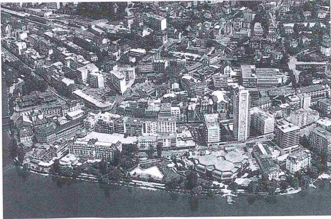
Die Flugaufnahme von Montreux kann gewisse städtebauliche Sünden nicht verdecken. Die Verleihung des Wakker-Preises 1990 soll hingegen der Wende in den Auffassungen von Bevölkerung und Behörden zur Pflege der vom 19. Jahrhundert geprägten baulichen Struktur die gebührende Beachtung verschaffen