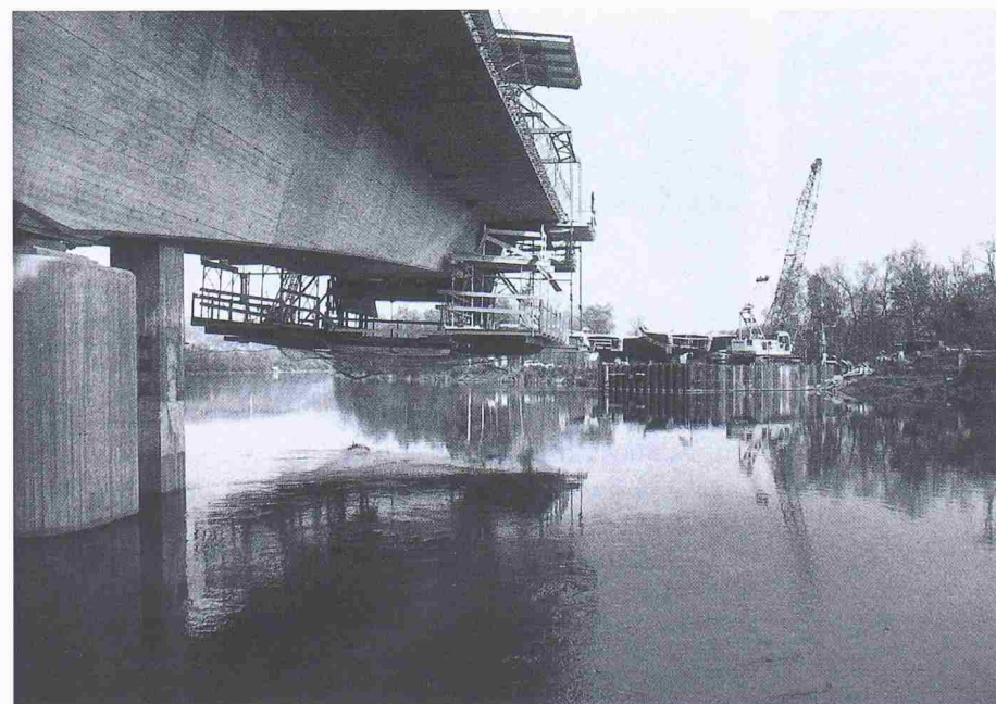
Auch 1989 stiegen die Bauaufwendungen der öffentlichen Hand nochmals an, wobei sich die Aktivitäten vornehmlich im Tiefbaubereich bewegten, wo einige Grossprojekte anstehen. Im Bild der imposante Bau der Aarebrücke, die zum Anschlusswerk der N3 an die N1 gehört

Auch 1989 sind die Bauaufwendungen der öffentlichen Hand nochmals angestiegen. Bund, Kantone und Gemeinden investierten dabei vermehrt in die Infrastruktur, vornehmlich im Tiefbau.