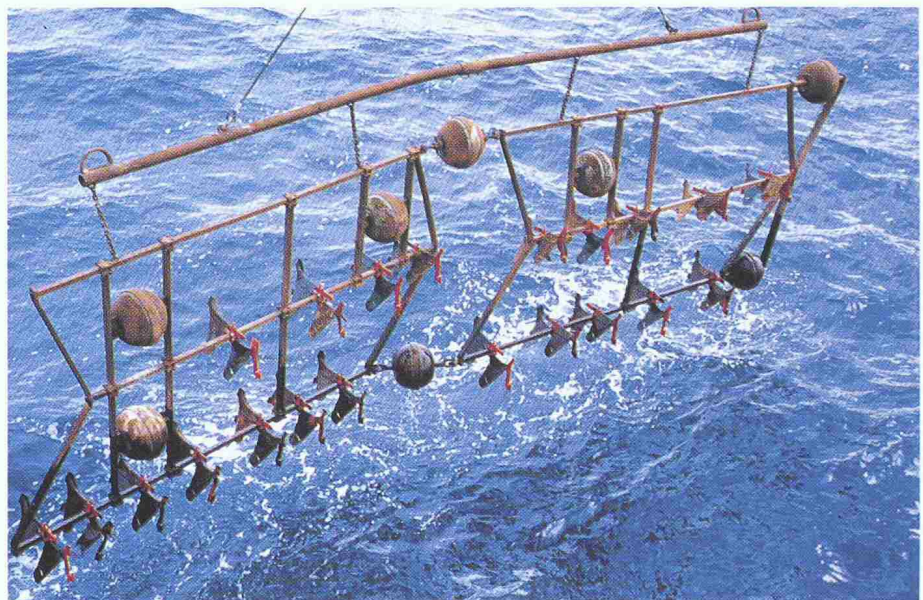
Die 8 m breite «Pflugegge», mit der das Manganknollenfeld beeinflusst wurde, kurz vor dem Einsatz

Wie in anderen Meeresgebieten ist die Besiedlungsdichte in 4150 m Tiefe nur gering. Trotzdem wurden zahlreiche Schwämme und Seegurken sowie einzelne Exemplare verschiedener Arten von Seenelken, Krebsen, Schnecken, Schlangen-, See- und Haarsternen, Tintenfischen und Fischen gefunden. Für besondere Aufregung sorgte ein insektenähnliches, fast weisses Tier, das mit sechs langen, dünnen Stelzbeinen und