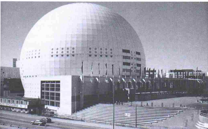
Die Stockholm Globe Arena

Die Stahlstruktur wurde in Teilsegmenten von 12×8,8 m am Boden vormontiert und mit Hilfe von vier riesigen Baukränen im freien Vorbau montiert. Die Montage der Fassade begann bereits nach Fertigstellung des 5. von insgesamt 19 Ringen.