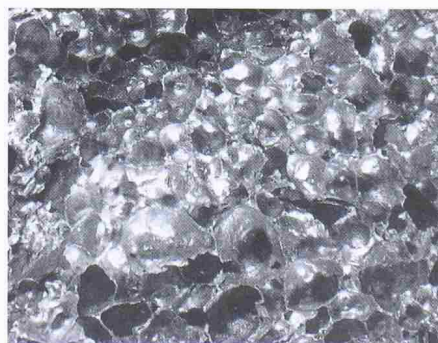
Vergrösserte Bruchflächen eines aufgeschäumten Metalls

Mitarbeiter des IFAM entwickelten nun ein Verfahren, das nicht nur einfacher, sondern auch besser reproduzierbar ist. Beim pulvermetallurgischen Herstellungsverfahren kann das Treibmittel so präzise dosiert und homogen im Metall verteilt werden, dass die Wissenschaftler dadurch in der Lage sind, über die Wahl der Herstellungsparameter die Dichte der Metallschäume in weiten Bereichen zu variieren. Standardmässig können damit Dichten zwi-