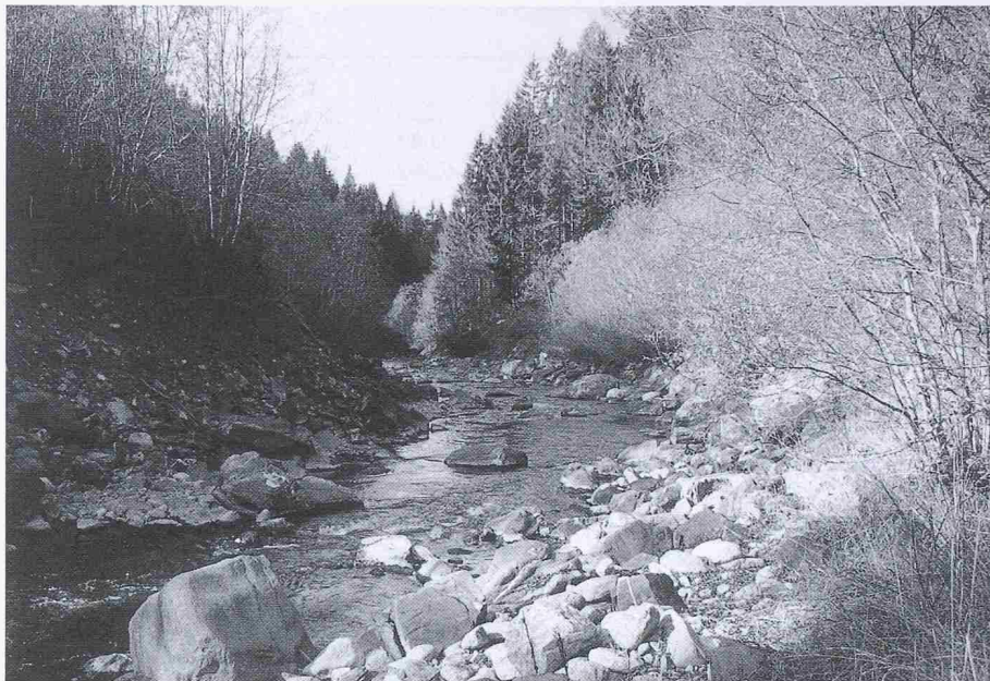
Bild 2. Naturnahe Landschaft

Im Sinne des Umweltschutzes ist die lokale Plazierung des Ausbruchmaterials erwünscht, trotz des gewaltigen Eingriffes in die Landschaft, und sie wird hier als gestalterisches Element aktiv genutzt. Die Verlegung des Stützbaches stellt dabei ein tiefgreifendes ökologisches Problem dar. Gerade die simultane Bearbeitung mit der Projektierung resultierte schliesslich in einer wesentlich besseren und ökologisch befriedigenden Lösung durch die Trennung