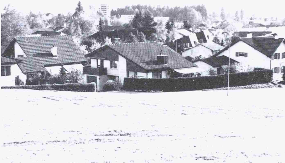
Bild 3. Einfamilienhausgebiete erreichen die rechtlich zulässige Dichte nur ganz selten

Die Raumplaner sind deshalb gezwungen, in ihren Kapazitätsberechnungen einen Korrekturfaktor einzubauen («Ausbaugrad» genannt), der sich meist zwischen 70% und 90% bewegt. Soll der Boden besser genutzt werden, stellt sich somit vorerst nicht die Frage, ob der Staat grössere Nutzungsmöglichkeiten zulassen soll (die in vielen Fällen das sinnvolle Mass überschreiten würden), sondern wie man die privaten Bauherren dazu bringt, vorgegebene Möglichkeiten auch tatsächlich zu nutzen. Oft scheinen Komfortbedürfnisse und Reserveabsichten der Bauherren diese zu veranlassen, nur einen Bruchteil der zulässigen Ausnutzung zu realisieren. So wird z. B. in zweigeschossigen Wohnzonen die mögliche Ausnutzung in der Regel um ein Drittel bis zur Hälfte unterschritten. Hier liegen noch ganz beachtliche Reserven, die aktiviert werden sollten. Aus den genannten Gründen wird in Fachkreisen die Einführung einer Mindestausnutzung diskutiert. Aber auch dieses Instrument kann nur angewendet werden, wenn eine Ausnutzungsziffer überhaupt existiert.