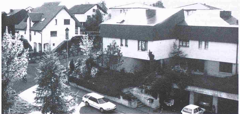
Bild 4. Beispiel einer dreigeschossigen Wohnzone, die trotz vermeintlich dichter Überbauung bezüglich Geschosshöhe und Dichte massiv unternutzt ist

Nutzung des Bodens (noch unveröffentlicht), wird die Existenzberechtigung von Dichteziffern untermauert.