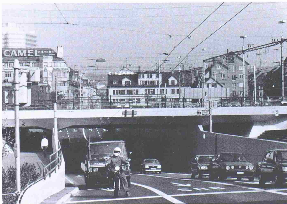
Ein Drittel unserer Energieaufwendungen wird vom Verkehr verbraucht, wobei der Löwenanteil davon natürlich aus Erdölprodukten stammt

1989 wurden rund 65% des Endenergieverbrauchs durch Erdölprodukte gedeckt. Davon wurden mit 46% fast die Hälfte allein durch den Verkehr verbraucht! Dafür war die Industrie mit einem Anteil von 34% knapp der grösste Verbraucher von Elektrizität.