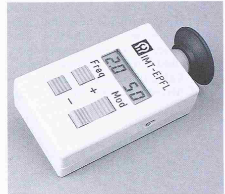
Visueller Stimulator zur Bestimmung der Flickergrenze des menschlichen Auges, der am IMT im Rahmen von Studentenprojekten entwickelt wurde

Wie bei den meisten Ingenieuren muss das Studium zuerst eine Grundausbildung in Mathematik, Physik, Chemie und Informatik gewähren. Der Unterricht über die Arbeitswerkzeuge, wie technisches Zeichnen, die Arbeit am