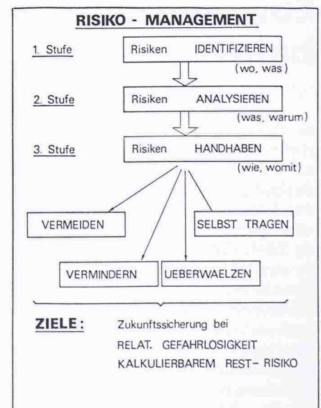
Bild 2. Risiko-Management: Da es keine absolute Sicherheit gibt, geht es darum, die unumgänglichen Risiken maximal in den Griff zu bekommen. Dabei sind drei Stufen zu unterscheiden, wobei sich die dritte in vier Möglichkeiten der Risikobewältigung gliedern lässt.

Die dritte Phase des Risiko-Managements, die Handhabung, gliedert sich in vier Möglichkeiten der Risikobewältigung: Vermeiden (zum Beispiel verzichten, andere Lösungen suchen, beseitigen, isolieren, Schutzmassnahmen), vermindern (begrenzen, Schutzmassnahmen, Kompetenzen regeln, Verhalten beeinflussen), überwälzen (Versicherungen, Haftung ausschliessend) und selbst tragen (Reserven bereitstellen, Ausweichmöglichkeiten schaffen, Restrisiko einkalkulieren).