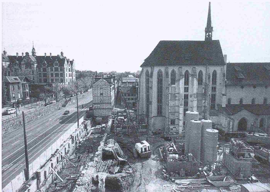
Teile der alten Zürcher Stadtmauer tauchten bei Aushubarbeiten für die Zentralbibliothek auf, im Bilde entlang des Hirschengrabens zu erkennen. Im Hintergrund der «freigelegte» Predigerchor

Welche Instanz schliesslich in dieser Sache entscheiden wird ist zurzeit noch ungewiss. Klar ist nur, dass das weitere Vorgehen noch einiges zu reden geben wird!