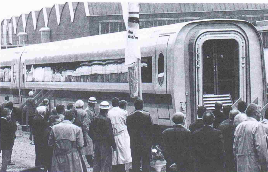
Premieren-Ausfahrt für die ersten Mittelwagen der ICE-Züge. Ab Juni 1991 werden sie für die Deutsche Bundesbahn unterwegs sein

In den Wagen mit Sondereinrichtungen befinden sich unter anderem ein Konferenzabteil mit speziellen Kommunikationseinrichtungen, behindertengerechte Einrichtungen, wie Stellplätze für zwei Rollstuhlfahrer und eine entsprechend gestaltete Toilette, ein Minibar-Depot sowie eine Telefonzelle für Wertkartentelefon. Hinzu kommen ein grosszügig gestalteter Eingangsbereich mit breiteren Stufen und Türen (90 cm) sowie Garderoben im Innenraum.