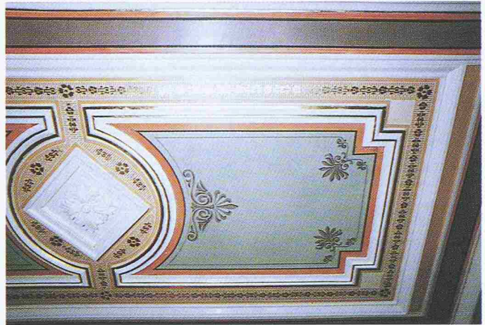
Bild 2. Ausschnitt aus der fertig restaurierten Deckenornamentik

sentlichen 1865–1871 errichtet, auszuräumen und in Etappen im Sinne seiner ursprünglichen Funktionslogik wieder herzustellen. Das «Entrümpeln» des Altbaus machte seine frühere Grosszügigkeit wieder sichtbar und liess das Verständnis für die Architekturqualität des ehemaligen Hauptsitzes der Nord-Ost-Bahn wachsen.