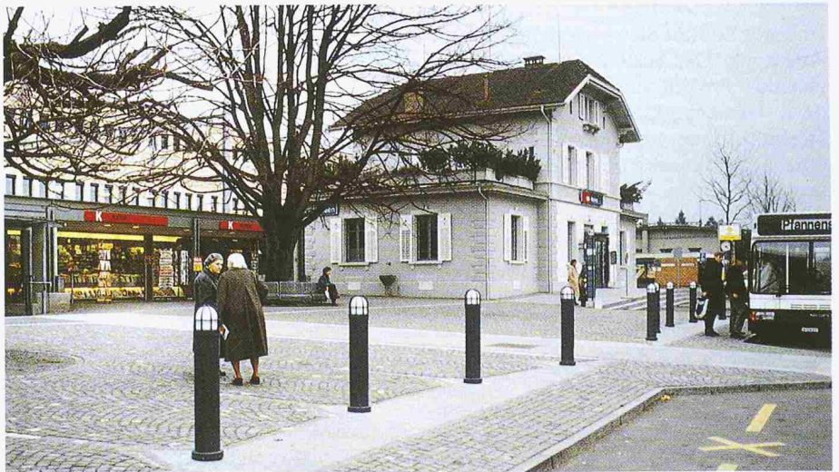
Bild 2. Bahnhof Meilen: Altes Bahnhofgebäude, neuer Kiosk und autofreie, fussgängerfreundliche Platzgestaltung