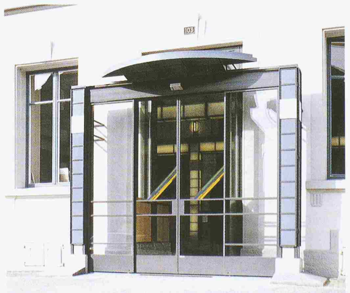
Bild 3. Neu gestaltete Eingangspartie zum alten Bahnhofgebäude