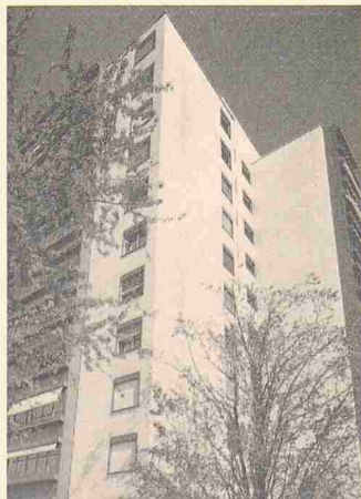
Fassadenrenovation mit Vilbofa-Elementen, Referenzobjekt in Glattbrugg ZH

Im Wettbewerb mit einer Vielzahl von Fassadenbekleidungen hat die von Villeroy & Boch entwickelte keramische Lösung unter der Bezeichnung Vilbofa aus glasierten, feinkeramischen Elementen eine stetig zunehmende Bedeutung gewonnen. Vilbofa stellt einerseits eine praxisgerechte Lösung dar, andererseits entspricht der als Fassadenbaustoff seit Jahrtausenden bewährte Werkstoff Keramik dem Trend zum verstärkten Einsatz natürlicher Materialien in der Architektur.