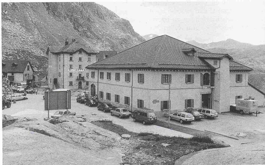
Ein Europa-Nostra-Diplom 1990 wurde für die Restaurierung einer Gebäudegruppe auf dem Gotthardpass vergeben

In letzter Zeit nimmt auch das Interesse aus den Oststaaten erfreulicherweise deutlich zu: So konnten diesmal zwei der fünf Medaillen in die Tschechoslowakei (Restauration des Prager National Theaters) und nach Polen (Restauration des Museums Sztuki in der Villa Herbst in Lodz) gehen. Vier Diplome wurden in die CSFR, nach Ungarn, Jugoslawien und in die Ukraine vergeben. Ho