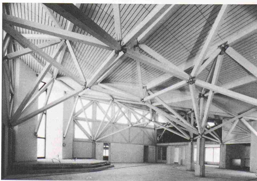
Die Kirche «St. Katharina von Siena» in Fällanden grenzt an ein Naturschutzgebiet. Im Innern steigern sich die Raumhöhen entsprechend der Bedeutung und werden im hohen Kirchenraum von einem sprengwerkartigen Raumfachwerk gleich einem Himmelsgewölbe überspannt

Bauherr: Röm. Kath. Kirchgemeinde Dübendorf Architekten: Peter Brader, Urs Nüesch, Schwerzenbach Ingenieur: Desserich + Partner, Luzern