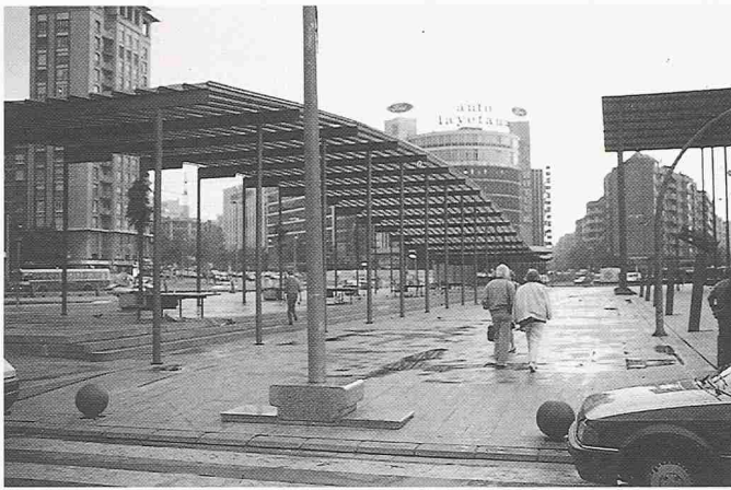
Bild 6. Neugestaltung eines Platzes am Rand der Erweiterung als Deckel des tiefergelegten Hauptbahnhofes (Plaza de Sants)