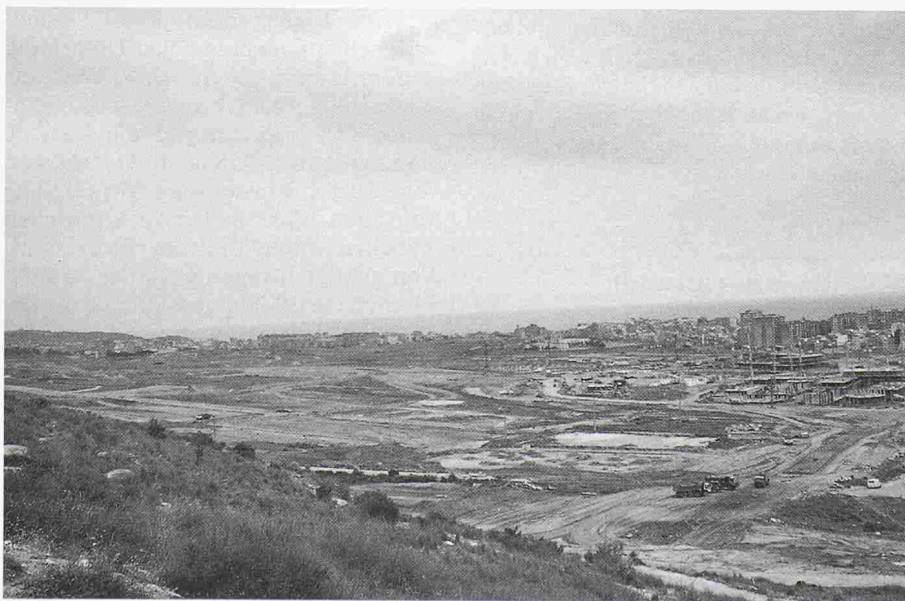
Bild 4. Stadterweiterung im Norden. Die Grossüberbauungen wälzen sich planmässig auf das offene Land

Die leider nur kurzen Besichtigungen solcher Anlagen liessen allerdings den Eindruck aufkommen, die Quartiere würden zwar «optisch» aufgewertet, doch durch die Sanierungen würde ein Teil des gewachsenen städtischen Gewebes mit eingessenenem Handwerk zerstört oder würde der unmissverständliche Wille zur Bildung einer polyzentrischen Stadt in Teilbereichen seine Grundlagen eher wegsanieren.