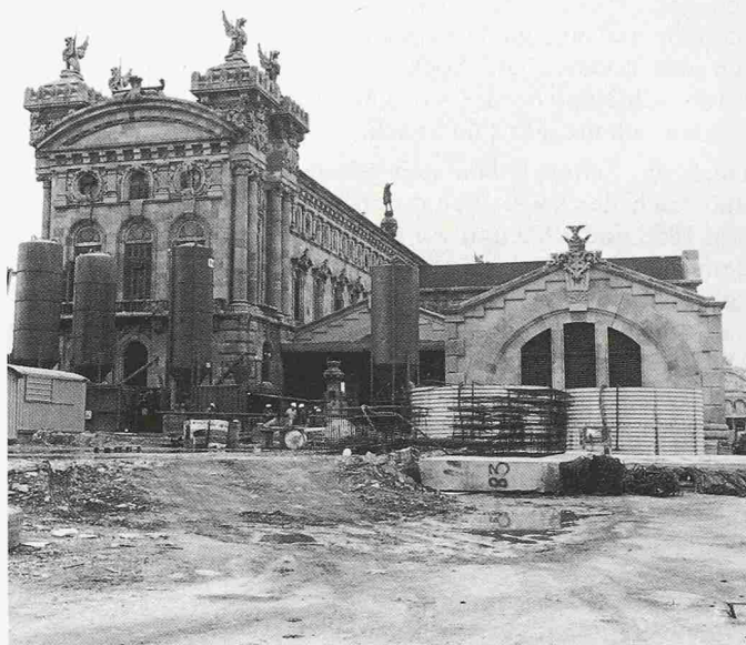
Bild 5. Zugunsten der neuen Uferanlagen müssen viele alte Gebäude weichen, zurück bleiben einige markante alte Gebäude als Erinnerung