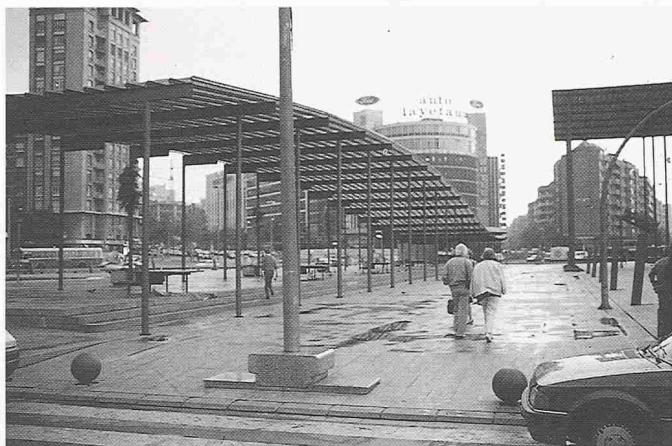
Bild 6. Neugestaltung eines Platzes am Rand der Erweiterung als Deckel des tiefergelegten Hauptbahnhofes (Plaza de Sants)