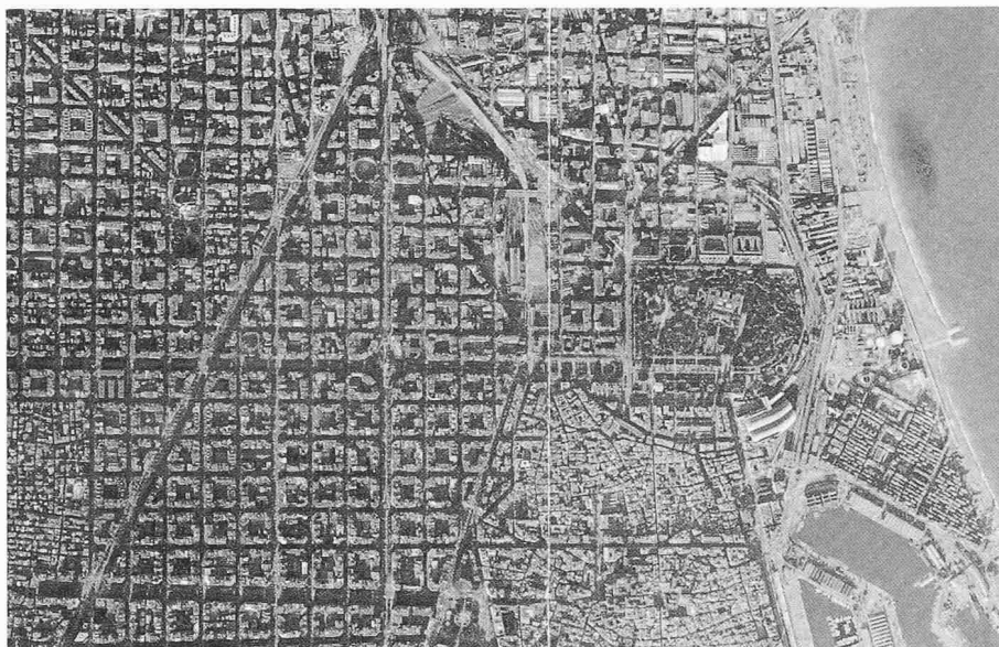
Bild 1. Luftaufnahme von Barcelona. Deutlich sind die Altstadt (rechts unten), die Erweiterung (Raster) und ein eingemeindetes, verstädtertes Dorf (links unten) erkennbar

Peripherie. Mit dem Wachstum der Dienstleistungsflächen im Zentrum und dem Wohnen in der Peripherie wächst notwendigerweise auch das Mobilitätsbedürfnis, hier – insbesondere wegen der fehlenden Akzeptanz des öffentlichen Verkehrs – befriedigt durch den Individualverkehr: «Man müsse quer durch die Stadt fahren, um zum Arbeitsplatz zu gelangen». Dies führt logischerweise zum (nicht zur Kenntnis genommenen) Luftproblem einerseits, aber auch zu einer übergrossen und folglich «urbanitätsfeindlichen» Verkehrsbelastung andererseits. Die Umschichtungen wurden offensichtlich nicht durch eine gleichzeitig verbesserte Infrastrukturplanung (von der Wasserversorgung bis hin zu den öffentlichen Verkehrsanlagen) ergänzt.