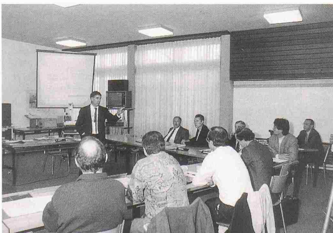
Seminarraum am Ausbildungszentrum des SBV in Sursee

Beschäftigen Sie sich mit der Evaluation eines CAD-Systems für ihr Unternehmen? Dann dürfte Sie dieses Seminar interessieren. Der SIA und der SBV